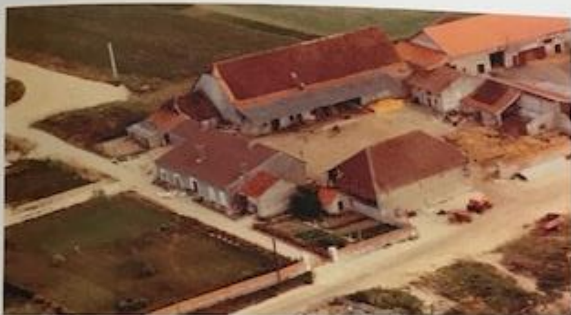
Vues aériennes de 1971