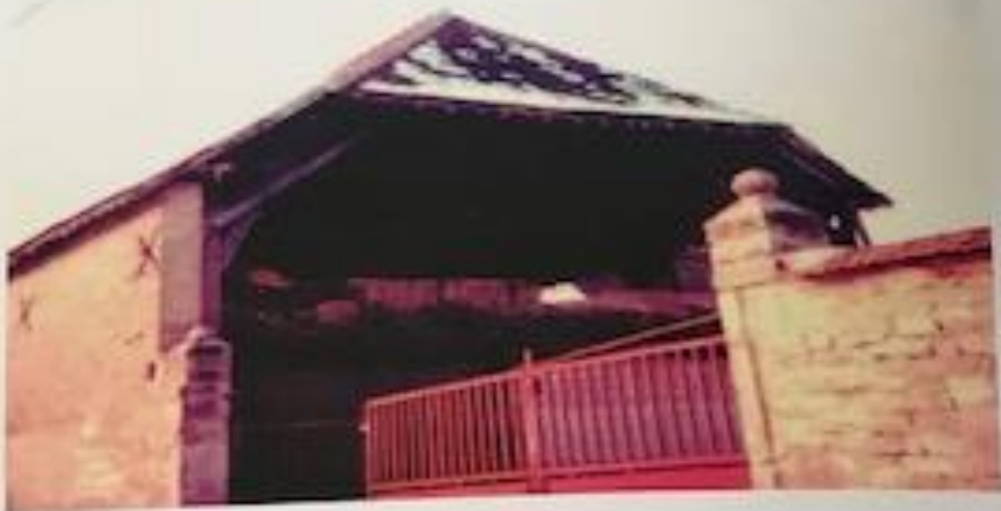
A sa déconstruction, on peut remarquer sa charpente très ancienne.