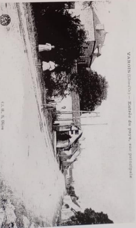
Ch. H. R. Dijon